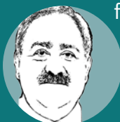
Attilio Scienza Ordinario di Viticoltura Università degli Studi di Milano

Ebbene, il vino ottenuto era maggiormente influenzato dal lievito che non dalla provenienza geografica. La ricerca continuerà per valutare anche il ruolo dei batteri sulle caratteristiche regionali dei vini. Recentemente anche il Consorzio del Barbera nell'ambito di un progetto di ricerca Wildwine ha accertato il valore dei lieviti spontanei nella originalità dei vini.