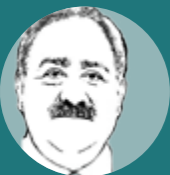
Attilio Scienza Ordinario di Viticoltura Università degli Studi di Milano