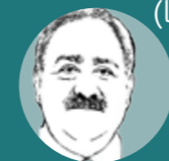
Attilio Scienza Ordinario di Viticoltura Università degli Studi di Milano