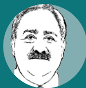
Attilio Scienza Ordinario di Viticoltura Università degli Studi di Milano